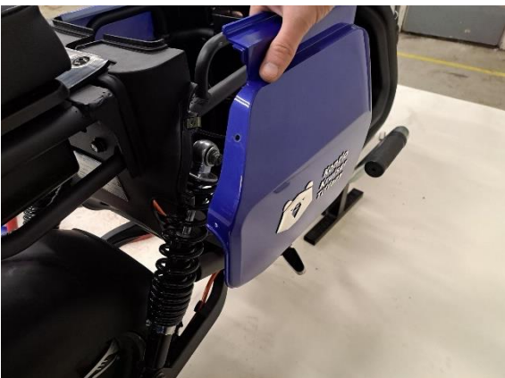
Ota istuimen oikea alapuoleinen sivumuovi pois.

Uuden osan asennus käänteisessä järjestyksessä.