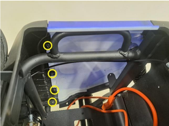
Irrota istuimen oikean alapuoleisen sivumuovin kiinnitysruuvit (ristipäämeisseli ph2).