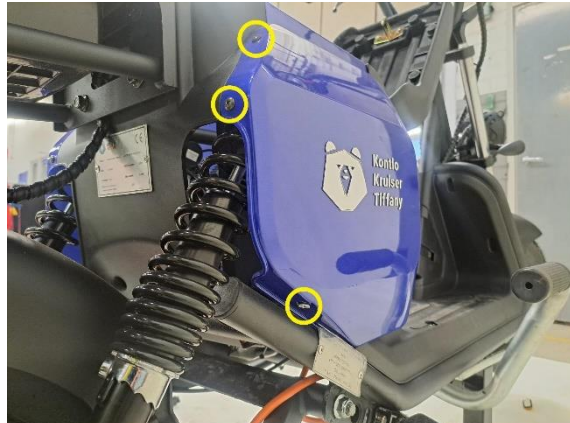
Irrota istuimen oikean alapuoleisen sivumuovin kiinnitysruuvit (ristipäämeisseli ph2).